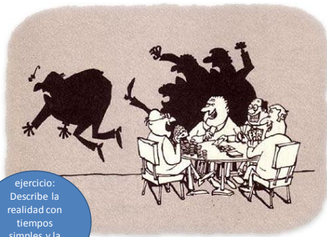
dibujo por Sergio Aragonés

Si pudiera cambiar algo de mi experiencia de niño, querría cambiar mi esfuerzo en nuestra práctica.